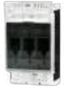
YA - 160