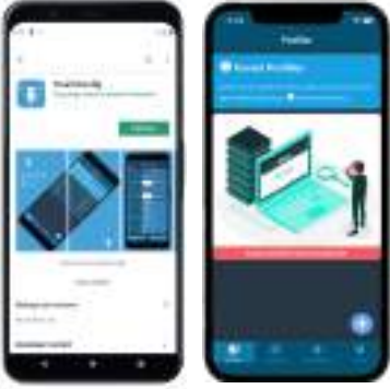
Uygulama Genel Görünümleri

► Profil Kayıt Özelliği Sayesinde Birden Çok Cihazı Hızlı Programlama